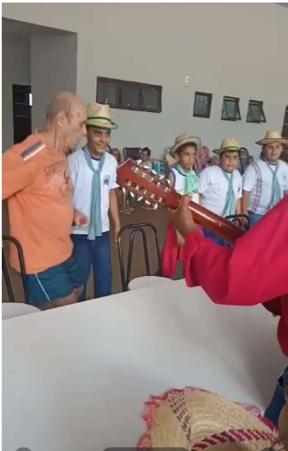
Comprovação continuidade ao projeto parceria prefeitura local