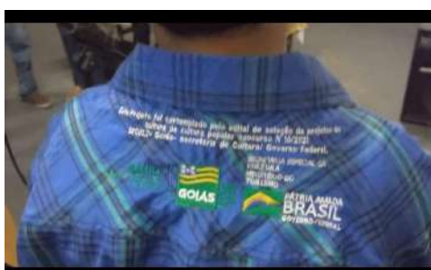
Foto logo uniforme juvenil