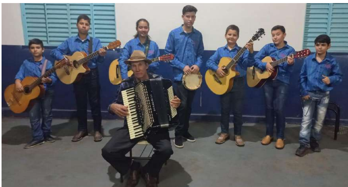
Todos uniformes foram bordados com as logos e descrição solicitados