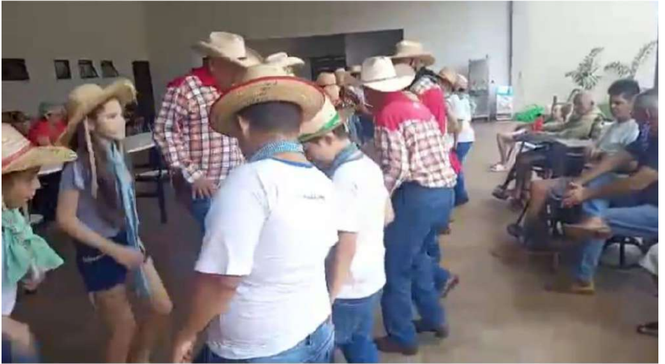
Dançando catira para os mordores do ab rigo dos idosos.