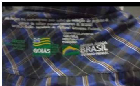
Foto logo uniforme dos Mestres