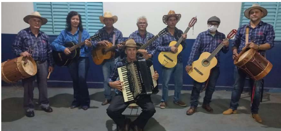
Equipe folia de reis nossos alunos uniformizados.